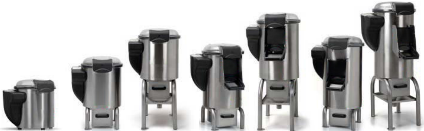
5 KG DA BANCO