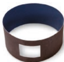
Tela abrasiva Abrasive wall